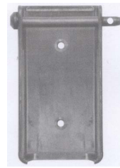
组件 2 主视图