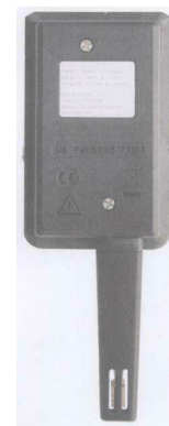
组件 1 后视图