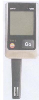
组件 1 主视图